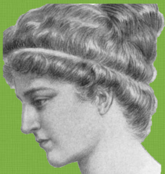
Ipazia d'Alessandria matematica V sec