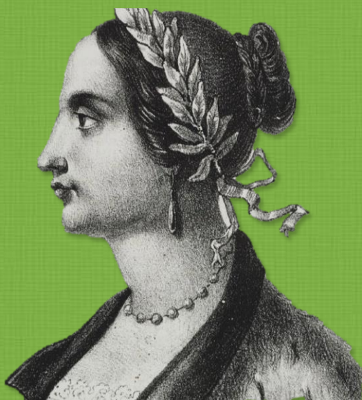
Laura Bassi Veratti fisica XVIII sec